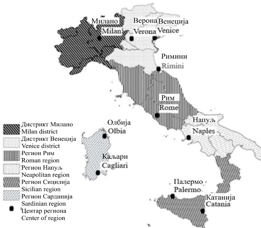
Сл. 1. Туристичко зонирање Италије